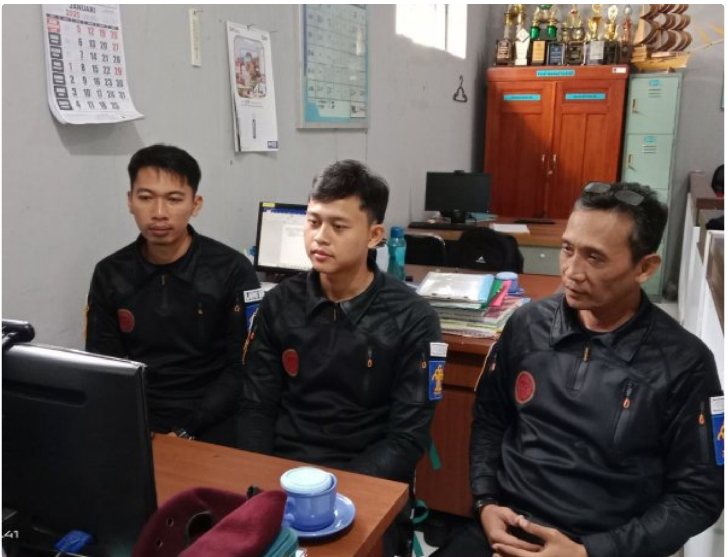
Bangun Harmoni dan Strategi, Lapas Besi Ikuti Webinar Refleksi Akhir Tahun 2024 & Resolusi 2025

CILACAP – Sebagai salah satu langkah dalam pengembangan kompetensi bagi Aparatur Sipil Negara (ASN), Petugas Lembaga Pemasyarakatan Kelas IIA Besi berpartisipasi dalam kegiatan webinar bertajuk "Refleksi Akhir Tahun 2024 dan